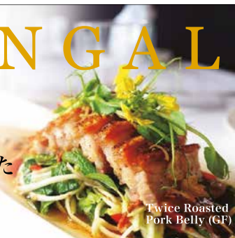
Twice Roasted Pork Belly (GF)