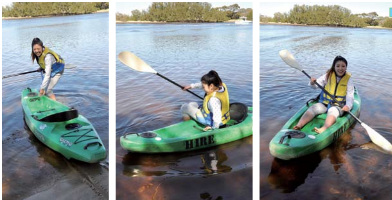
まずは、水面にカヤックを浮かべ、腰を下ろしてカヤックに乗り込みます。足を前に伸ばしたら、準備OK！