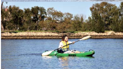
カヤックに乗って、スワン川の上を探検！？パドルで左右交互に漕ぎ、水面を縦横無尽にスイスイ進んでいきます。船も行き交うスワン川では、橋の下は左側通行です。