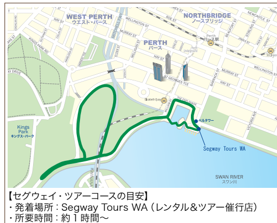
【セグウェイ・ツアーコースの目安】 ・発着場所: Segway Tours WA (レンタル&ツアー催行店) ・所要時間: 約1時間~

「操作を練習してからツアーに出発するので、セグウェイに乗るのが初めての方も安心です (Stobie さん)」