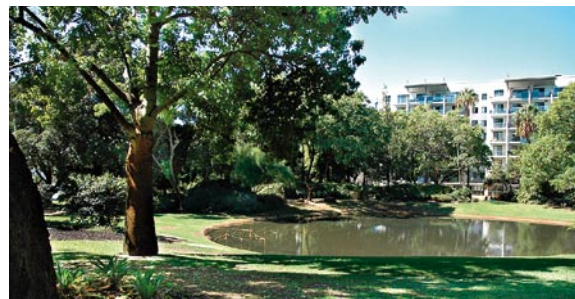
横には近代的なアパートメントが建つ

そして、この庭園は結婚式の会場としても利用され、各エリアに分かれた庭園内では、その美観と共に記念撮影が行われています。アクセスはキャットバス以外に、電車フリーマントル線のシティー・ウエスト駅で下車し、徒歩1分で訪れることもできます。