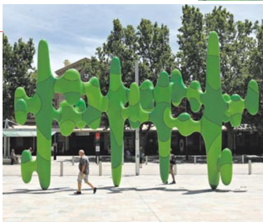
左：通りを行き交う人々の関心をそそる存在感 右：公式パンフレットからのイメージ

パース駅南側に位置するフォレスト・プレイスに完成した3Dオブジェ。33カ国、202作品の応募があった中から選ばれた作品で、タイトルは『Grow Your Own』。制作途中の段階では、その独特な形状から“that Giant Green Blob”や“The Cactus”などのニックネームで呼ばれていた。体感型の作品となっているので、直接自分の手で触れ、もたれたり、周りを歩きながら下を通り抜けたりすることもできる。作品の大きさは、幅11m、奥行き3m、高さ6.5m。