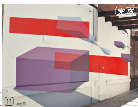
作品名：Burst Generator 2011 /アーティスト：Caspar Fairhall 氏