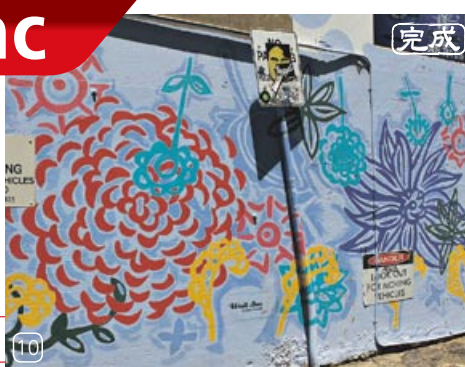
作品名：Blue Snake and Red Bird 2011 /アーティスト：Susan Flavell 氏

現在、パース市内の特定箇所にて、アーティストによる壁画作品を鑑賞することができる。このプロジェクトは、テーマのない壁画作品のシリーズとして、街の魅力を高めつつ、壁の落書きを減らすという目的を備え、街ゆく人々により自由な芸術へのアプローチの手段を提案する。また、ストリートに視覚的多様性をもたらすという効果もある。アーティストたちによって、それぞれの壁面がもつ特性を活かしなが作品は制作されている。現在も同プロジェクトは進行中。