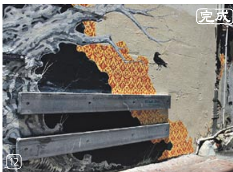
作品名：A Fragmented Tale 2011 /アーティスト：Clare McFarlane 氏